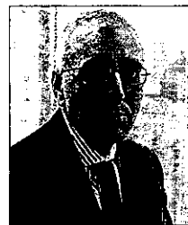
José Miguel Andrés, presidente Ernst & Young.

En general, las medianas auditoras encuentran complicado gestionar grandes cuentas que permitan su crecimiento. No obstante, se espera que el nuevo Plan General de Contabilidad, que transpone la norma europea que obliga a adaptar las cuentas a las normas internacionales, permita incrementar sus ingresos